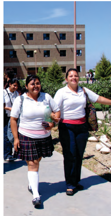
Palabras clave: gestión directiva, liderazgo

En ese marco de referencia aparecen como elementos fundamentales las actividades asociadas a la gestión de los directivos pues se reconoce en múltiples estudios que su influencia es determinante para el buen desarrollo de los procesos institucionales. Habría que considerar a la gestión directiva como la oportunidad de articulación de procesos sistemáticos que permitan el desarrollo de la actividad educativa, no constituirse como medio y fin, sino como medio. Como cualquier acto donde se pongan en juego un grupo humano, existen intenciones explícitas o no; relaciones de poder, efectos conductuales, valores individuales, colectivos; representaciones simbólicas, imaginarios, lenguajes, ansias de legitimación, etc. Uno de los componentes de la gestión directiva es el liderazgo, mismo que se define como una capacidad con la que debe contar el directivo para orientar a los actores que conforman el proceso educativo hacia el logro de los objetivos y metas de la institución. Considerando estos referentes, se planteó el objetivo de estudiar este componente en escuelas de nivel Medio Superior particularmente del subsistema CECYTE. El estudio contempló 779 sujetos, todos ellos docentes de tiempo completo y asignatura y tres ámbitos de análisis: Liderazgo, grado de instalación de los sistemas de liderazgo y grado de mejoría que requiere el liderazgo.